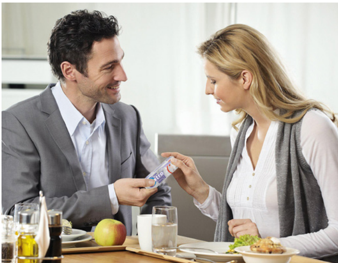
Kaugummi zur Zahnpflege – die ideale Prophylaxe für zwischendurch

Hier ein belegtes Brötchen, da ein Stück Pizza, dort ein Cappuccino: Wir leben in einer mobilen To-Go-Gesellschaft, in der schnelle Snacks geregelte Mahlzeiten häufig ersetzen. Gegessen wird unterwegs und zwischendurch, wann immer es gerade passt. Das passt zwar in unsere mobile Gesellschaft, bedeutet für die Zähne aber Dauerstress. Ergänzende Zahnpflege für untertags ist in diesem Fall gefragt, wie dieses einfache, aber effektive und wohlschmeckende Rezept: Direkt nach dem Essen und Trinken einen Kaugummi zur Zahnpflege wie EXTRA Professional kauen!